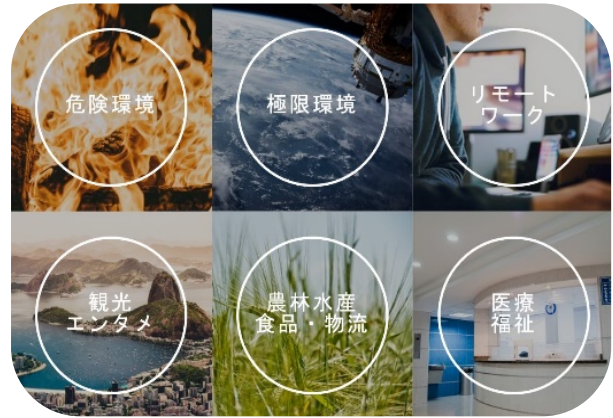
写真2：アバターロボットの想定動作環境