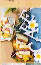
カフェランチボックス