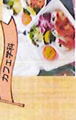
ガーリックシュリンプ