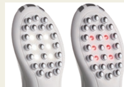
左：白LED [リフトケア] 右：赤LED [エイジングケア]