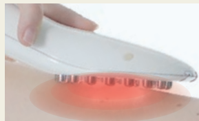
温感RF(ラジオ波) ※イメージです