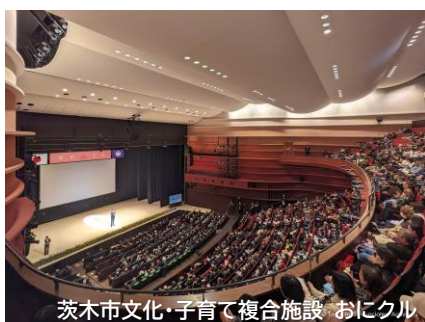
茨木市文化・子育て複合施設 おにクル