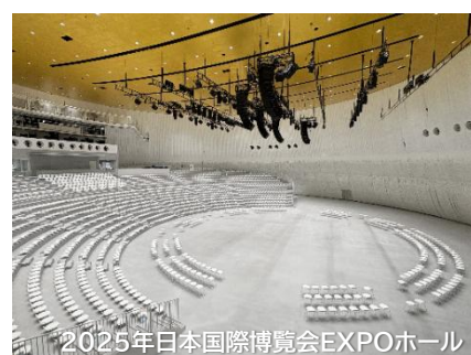
2025年日本国際博覧会EXPOホール