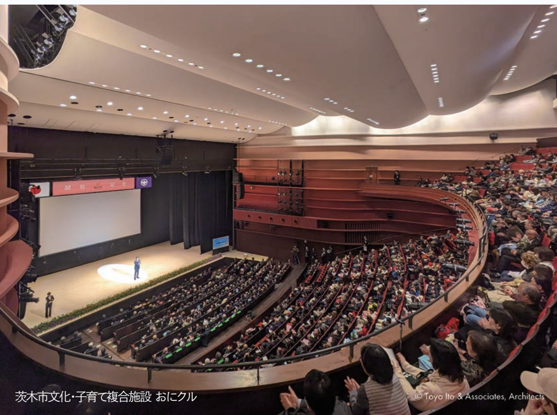
茨木市文化・子育て複合施設 おにクル

開場 18:00 講演 18:30 - 20:00 オンライン配信あり / 講演後、懇親会あり