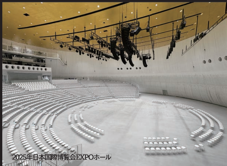
2025年日本国際博覧会EXPOホール