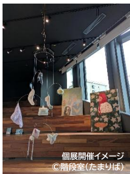
個展開催イメージ