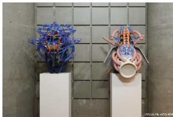
《移送の庭先》2024年 ©鷺見友佑