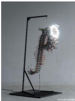
《E-148(light)》, 2018年 ©鷺見友佑

「本展では、彫刻家・向井良吉の代表的な連作《蟻の城》の研究を通して得られた視点をもとに制作した作品群《流し身》を発表する。《蟻の城》の制作プロセスに関する再現実験を契機として取り組んできたZAS合金鑄造の技法を基盤としながら、「変身」をめぐる素材と造形の関係を探る。」