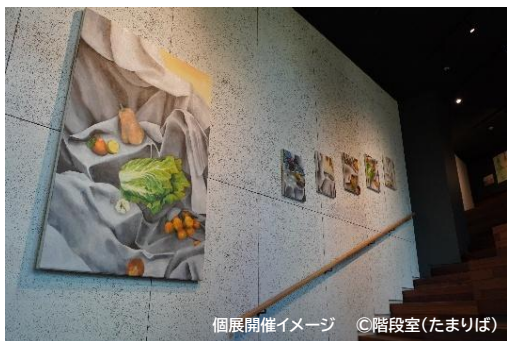
個展開催イメージ