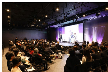
本番中のステージと客席の様子。熱心に聞き入る観客の方たちで満席。