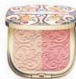
ソーラーグロウ イルミネーティングパウダー デュオ