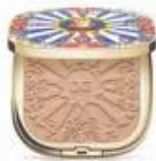
ソーラーグロウ ウルトラライト ブロンジングパウダー