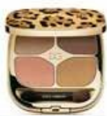
フェリンアイズ インテンスアイシャドウクワッド