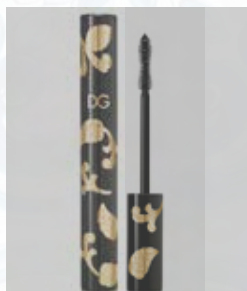
パッションアイズ インテンスボリュームマスカラ