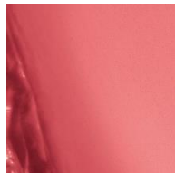
240 <Sweet Mamma> 甘さと強さを兼ね備えた王道ピンク。わがままな女性の願いを叶えてくれる救世主カラー。