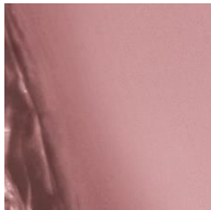
150 <Creamy Mocha> 落ち着いたトーンで女性らしい上品な印象と裏腹に媚びない魅力を引き出すモカブラウン。