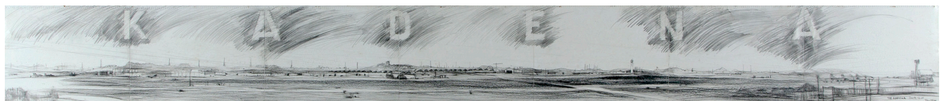
8. THE KADENA (2004)