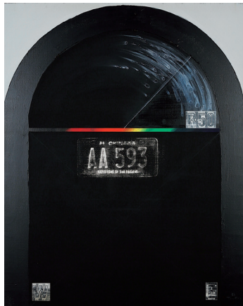
4. 記憶のイエローナンバー (1983)