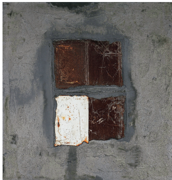
5. Unknown (1997)