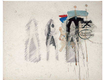
3. ドローイング (1970年代)