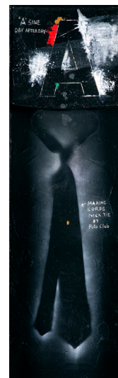
6. Unknown (2004)