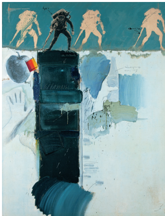
1. Unknown (1975)

広報用図版として8点をご用意しております。画像掲載ご希望のかたは必要事項をご記入の上、画像番号に○をつけて、FAX またはメールにてお送りください。