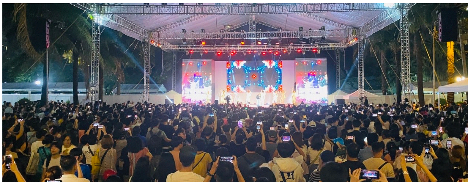
※JVF 過去開催時の様子

これまでの基本方針である「日越官民一体型のイベント」をさらに深化し、未来を見据えた文化、社会、経済、学術を通じた交流を目的とした特別企画を中心に据えます。昨年2023年に日越外交関係樹立50周年を迎えた両国にとって、新たな50年に向けた新しいスタートを切るために、日越関連民間企業や政府機関と連携し、さらに進化するベトナム最大級の日越交流イベントを目指します。