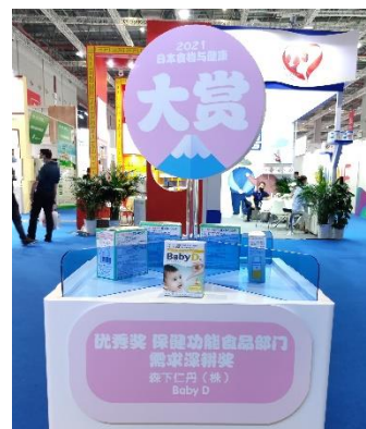
日本健康食品大賞特設ブース展示の様子

ビタミンDは、食事から摂取するほか必要量の約80%が日光に含まれる紫外線を浴びることで体内で生成されることから「太陽のビタミン」と呼ばれていますが、 昨年から続く外出自粛の影響で例年になく日光を浴びる機会が少なくなっており、現在、世界各国でビタミンD不足への関心が高まっています。 ビタミンDは、腸管でのカルシウムの吸収を促し骨の形成を助けるビタミンで、急速に発育がすすむ新生児や乳幼児、また成長期の子供にも欠かせない栄養素ですが、紫外線を避ける生活習慣が好まれる近年、日本人の全ての世代で不足していると言われていたビタミンです。