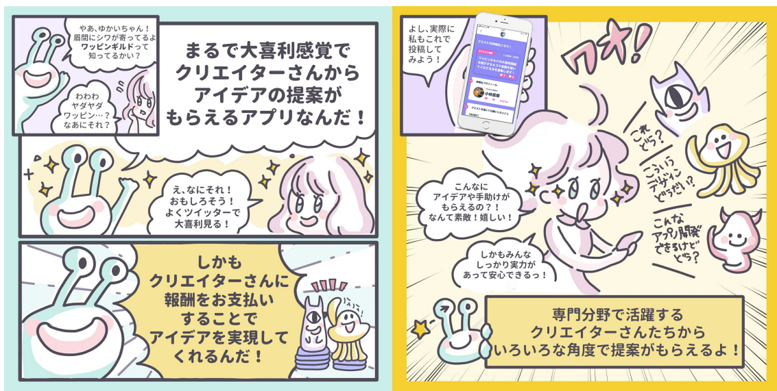
ワッピンギルドのご紹介漫画