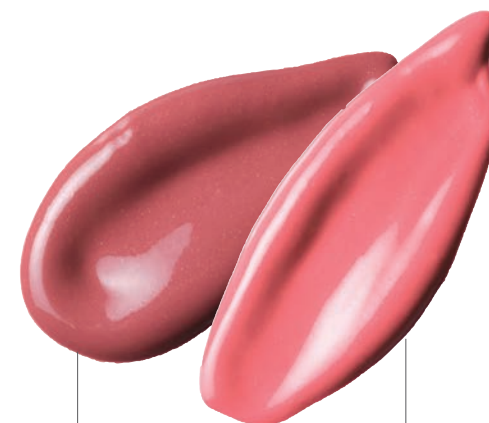
MOCHA BROWN モカブラウン

ジューシー プランパー リップス 全2色 (モカブラウン・ブラッシュローズ) 各¥3,960(税込)