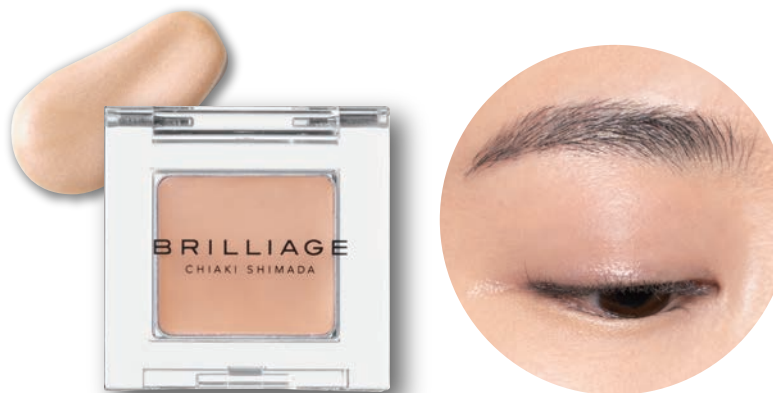
EYE SHADOW BASE & HIGHLIGHTER