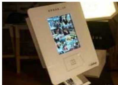
(3) プリントマシンで印刷