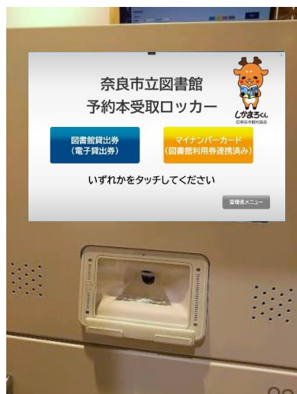
図書受取ロッカーの操作パネル