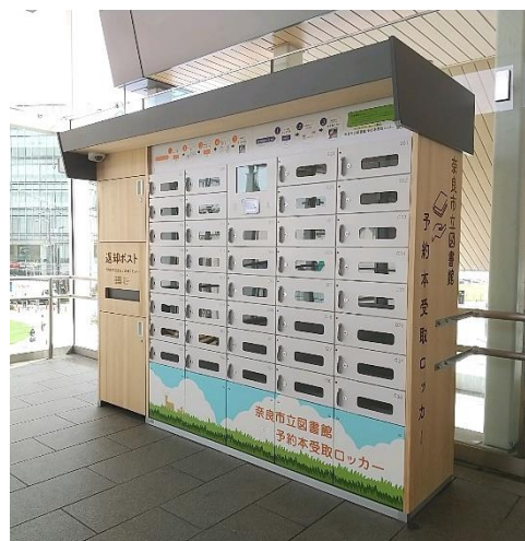
近鉄大和西大寺駅南北自由通路内 設置ロッカー

* 近鉄大和西大寺駅南北自由通路に 既設の返却ポストがありますので、 近鉄大和西大寺駅南北自由通路内の 返却ポストは2カ所になります。