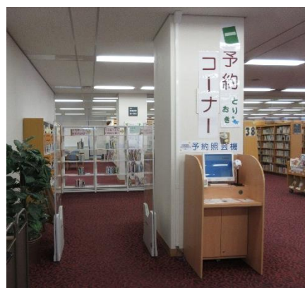
セルフの予約本とりおきコーナー