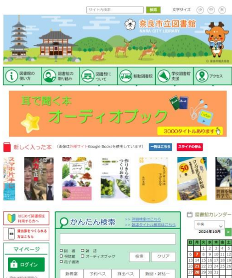
奈良市立図書館ホームページ