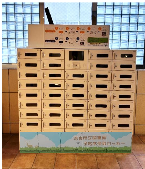
西部会館内設置ロッカー