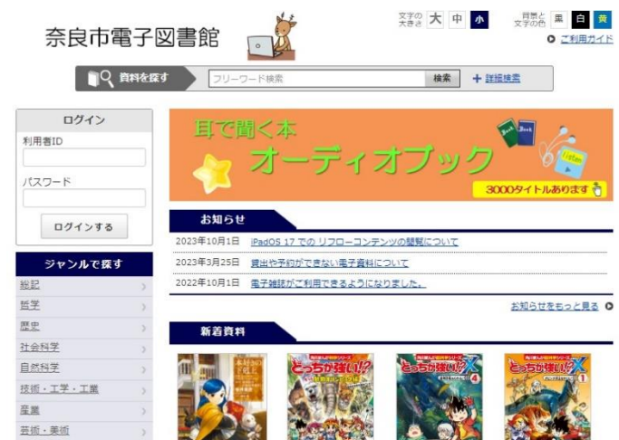
電子図書館のトップページ

電子書籍や電子雑誌、オーディオブックなどの電子資料を、お手持ちのスマートフォンやタブレット、パソコンで利用することができます。