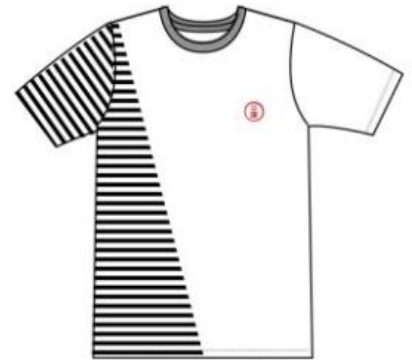
済スタンプボーダーTシャツ

価格 : ¥3,500+tax サイズ : (レディース)FREE (メンズ)M/L