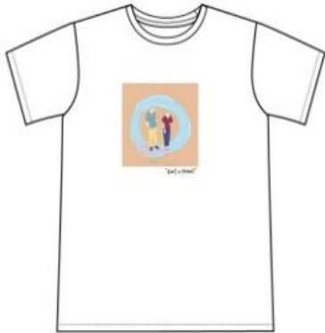
イラストプリントTシャツ

価格 : ¥3,000+tax サイズ : (レディース)FREE (メンズ)M/L