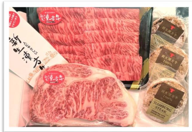
※1 セットお届けイメージ

発売開始初日にご購入の 3 名様に、黒毛和牛の 1.5 倍のうま味成分を持つ、宮城県栗原市の「漢方牛セット」をプレゼント。購入するなら初日がおススメ！