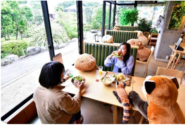
癒されながらソーシャルディスタンスを確保できる

営業時間 11:00～15:00 L.O (2020年5月20日現在) ※詳しくは公式HPをご確認ください