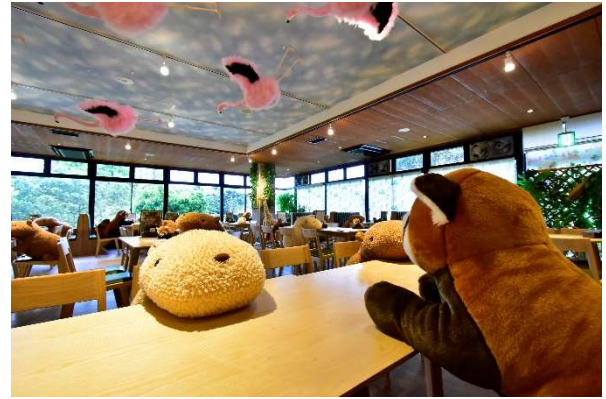
人と人が離れていても寂しさを感じない