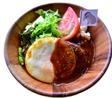
「バクバクハンバーグ」 1,200円(税込)