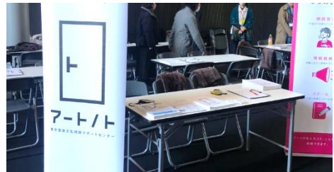
令和6年1月「ART JOB FAIR」内での出張相談の様子

[令和5年度対応件数] 351 件（内、出張相談68件） ※開設期間：令和5年10月2日～令和6年3月29日