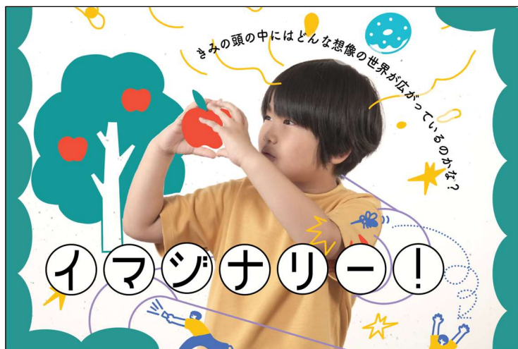
「イマジナリー！」メインビジュアル

公益財団法人東京都歴史文化財団 アーツカウンシル東京は、東京都とともに、地域社会を担う NPO と協働しながら、社会に新たな価値観や創造的な活動を生み出すためのさまざまな「アートポイント」をつくる事業「東京アートポイント計画」に取り組んでいます。