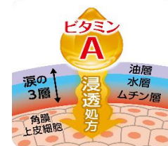
図. 角膜修復アプローチ(イメージ図)

ビタミンAが様々な症状の共通原因の一つである“角膜ダメージ”の修復を促進します。