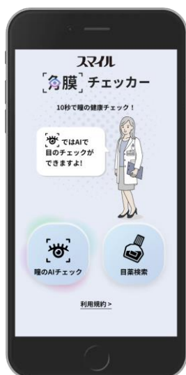
『スマイル角膜チェッカー』 スマートフォンのメニュー画面 (イメージ)