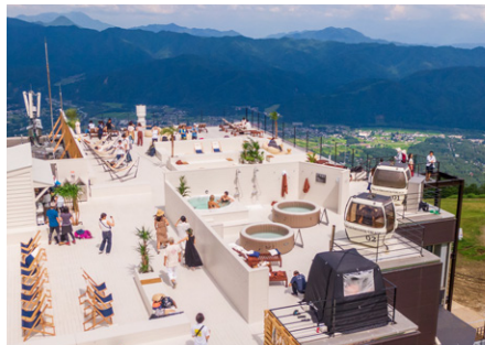
HAKUBA MOUNTAIN BEACH