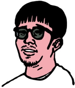
キャラクターデザイン FACE(フェイス)

台湾人の父と日本人の母を持つ、東京生まれのアーティスト/イラストレーター。アパレル、広告、雑誌を中心に国内外問わずグローバルなアーティストとして活動の幅を広げている。近日中に香港での展示も控えている。