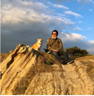
ロゴデザイン SANKOFA 富安 修一

神奈川を中心に国内や海外のブランドやショップのロゴをデザインするほか、SPツール、CDや商品パッケージ等も手掛ける葉山在住グラフィックデザイナー。葉山芸術祭や逗子海岸映画祭などの近隣コミュニティのデザイン参加経験も多い。