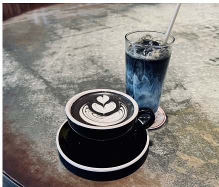
モノクロームラテ（Hot / Iced）