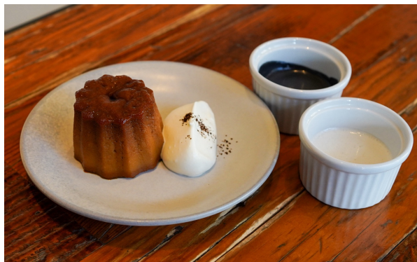
カヌレプリン（胡麻黒蜜 / ココナッツ）