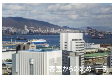
客室からの眺め 一例

神戸ポートピアホテルは、登山支援拠点「トレイルステーション神戸」とコラボレーションし、トレッキング（山歩き）を体験してみたい方や登山初心者をターゲットに、登山グッズのレンタル付き宿泊プランの予約受付を2023年10月24日（火）より開始しました（同プランの受け入れは10月28日（土）～）。また、2023年12月10日（日）には登山ガイドから山歩き楽しみ方を学ぶ1日限定のトレッキング講座を開催します。