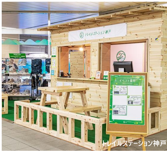
トレイルステーション神戸