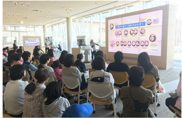
〈2018年度Asia week出展・特別講演の様子〉

アドベンチャーワールド（和歌山県白浜町）は、10月13日（日）立命館大学大阪いばらきキャンパス（大阪府茨木市）で開催される「Asia Week 2019～立命館でアジアとつながる国際交流フェスタ～」に出展いたします。動物たち（4種）とのふれあいコーナーをはじめ、SDGsに関するコーナーやジャイアントパンダ飼育スタッフによる特別講演を行います。立命館大学の留学生・学生とともに、一人でも多くの方々にアジアを身近に感じていただき、未来の世界を考えるきっかけを広げます。