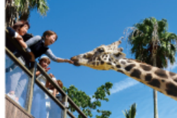
野生を感じる、自然からの 熱いメッセージに耳を傾ける、ひととき