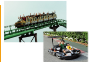
型にこだわらない遊びがまっている