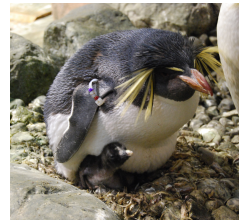
赤ちゃんと過ごす親鳥