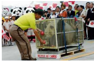
2000年七夕の日に来日した「梅梅」