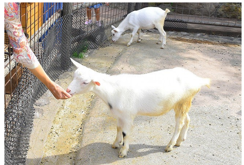
ヤギのフィーディング