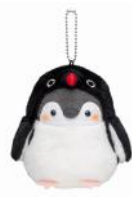
アデリーペンギン