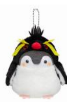
キタイワトビペンギン