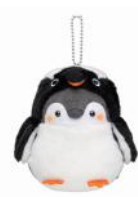
ジェンツーペンギン