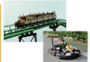
型にこだわらない遊びがまっている