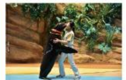
遠い昔から一緒だった 海からのやさしい贈り物に出会う