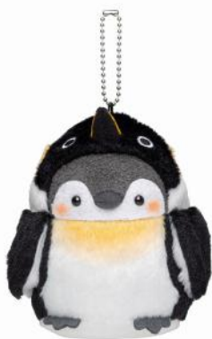
エンペラーペンギン

（1）アドベンチャーワールドで暮らす8種類の『ペンギンさんになっちゃった～！なマスコット』販売 （各1,430円・税込）パーク内ギフトショップ、およびオンラインショップにて販売