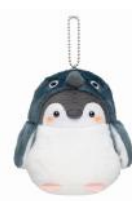
フェアリーペンギン