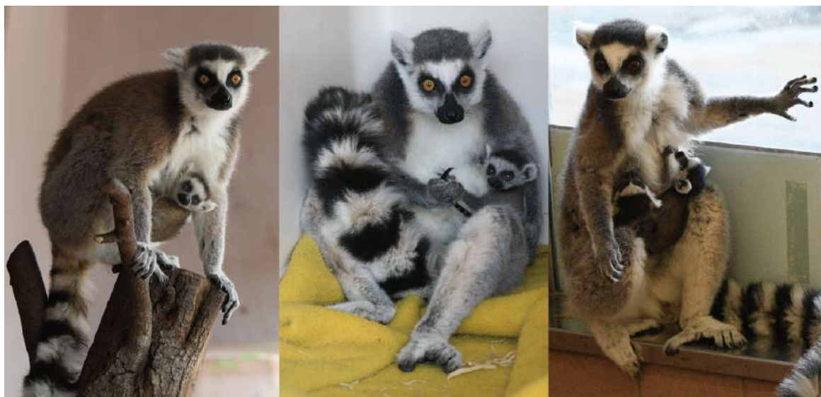
ワオキツネザルの親子（2021年3月24日・26日撮影）

アドベンチャーワールド（和歌山県白浜町）において、2021年3月に 4頭のワオキツネザルの赤ちゃんが誕生 しましたのでお知らせいたします。アドベンチャーワールドでは 3年連続 となる赤ちゃんの誕生であり、今回誕生した赤ちゃんを含め現在18頭（オス6頭、メス8頭、不明4頭）が暮らしています。