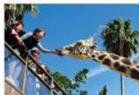
野生を感じる、自然からの 熱いメッセージに目を傾ける、ひととき