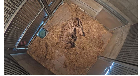
観察カメラの様子

出産直前から外的刺激を避けるため親子が暮らす部屋に目隠しを設置し、安心して過ごせる環境づくりに努めています。 現在は、部屋の天井に設置しているカメラで親子の様子を観察しています。赤ちゃんは大きな声で鳴き、母親にミルクをねだることもあります。母親は初めての子育てですが子を丁寧に毛繕いしたり、落ち着いて授乳したりする様子を確認できています。