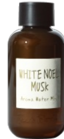
Aroma Water Mini