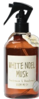
Fragrance & Deodorant Room Mist