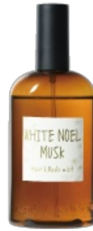
Hair & Body Mist