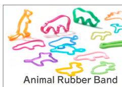
Animal Rubber Band

+dは、デザイナーがモノに込めた想いやメッセージを世界に届けるブランドです。初めて製品化したアニマルラバーバンドをはじめ、100名を超えるデザイナーのメッセージを形にしています。