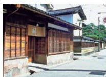
長屋門跡とまちなみ