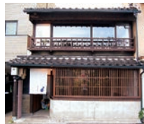
町家ダイニング あぐり