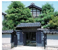
海月が雲になる日