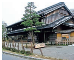
金沢市老舗記念館