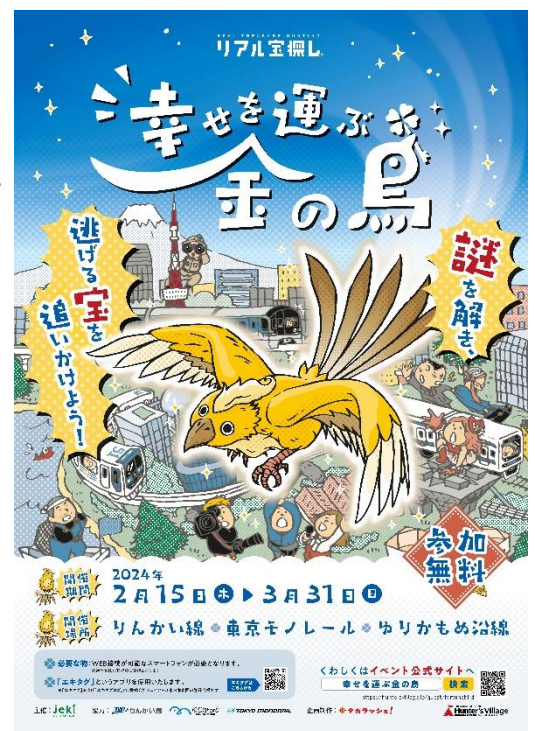
【ポスターイメージ】

本企画の内容については「タカラッシュ」が運営する「ハンターズヴィレッジ」( https://huntersvillage.jp/ )にて掲載いたします。(2月1日(木)14時オープン予定)