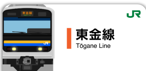
東金線スタンプ帳ラベル