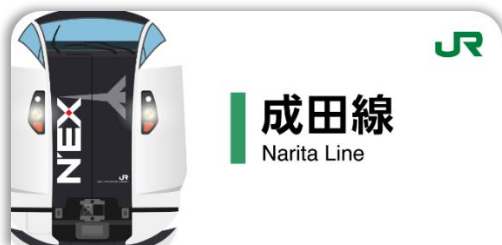
成田線スタンプ帳ラベル