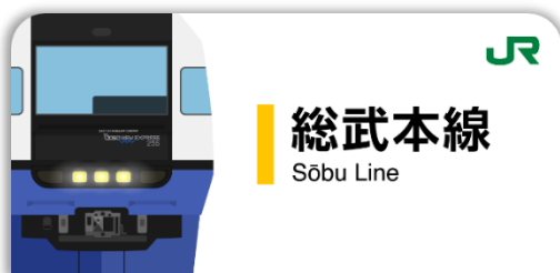
総武本線スタンプ帳ラベル