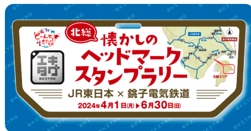
キャンペーンバナー