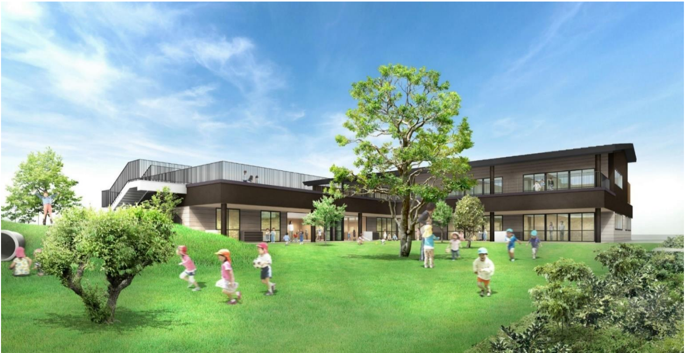
東京都初となるインクルーシブモデル（仮称）東大和どんこ保育園および（仮称）子ども発達支援センターつむぎ 東大和

厚生労働省から発出された省令改正を受け、全国で本格的な取り組みが始まっているインクルーシブ保育。どんこ会グループはそのパイオニアとして、2015年から8年にわたり現場実践で得た知見を生かし、障害の有無にかかわらず子どもたちが共に育ち合う環境を全国に広げていきます。