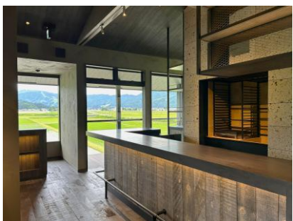
ビアレストラン「焚火の台所」を併設（2階）

※1 厚生労働省「野生鳥獣肉の衛生管理に関する指針」を遵守した安全な食肉のみを使用