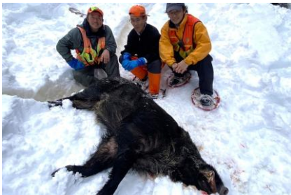
捕獲したイノシシの前に（左から高堀代表、地元猟師の方、諸我本部長）

深刻化する地域課題を、 命・食・保育の循環型ビジネスモデル で解決する新たな 地方創生 への挑戦です。