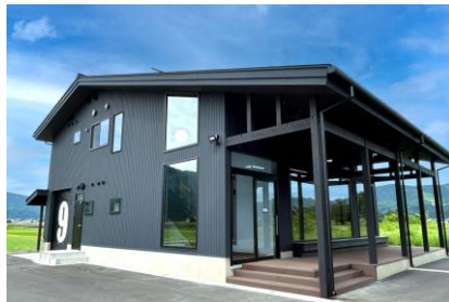
「解体加工×ブルワリー×飲食店」の3機能を併設した施設外観