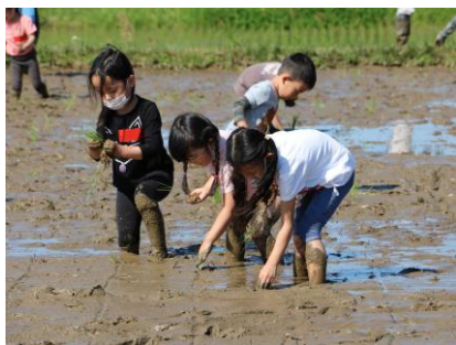
どろんこ米の全国消費量106トン（2025年度）