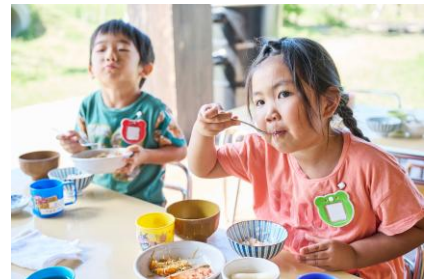
ジビエ給食として全国の施設へ