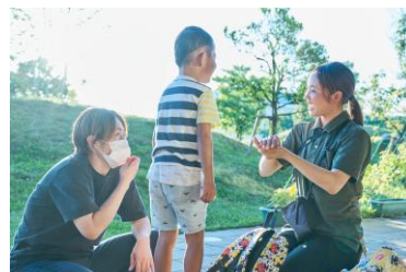
保護者からの多様な相談体制を構築

Web、電話、ご意見BOXなどさまざまな相談窓口を設置し、アンケートや面談を通じて早期発見に努める体制を整備。