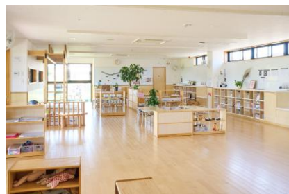
死角の少ない園舎設計