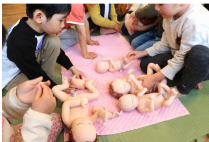
5歳児対象性教育プログラム