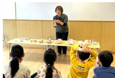
性教育プログラムで胎児の成長を知る

2003年より毎年、全施設の5歳児へ「プライベートゾーン」等を伝える性教育プログラムを実施。保護者会等でもその意義を共有。