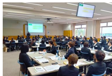
全内定者向けに「こども性暴力防止法」に関する研修を実施（2026年）

保育室の壁をなくす等の「死角をつくらない園舎設計」に加え、施設長・主任による不規則な巡回を実施。