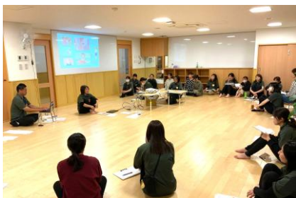
性的虐待の定義・対応フロー制定や、研修の実施

こども家庭庁が公表した『令和8年版こども白書』に、どろんこ会グループ（本社：東京都渋谷区）の性暴力防止に関する取り組みが民間事業者の先進事例として紹介されました。どろんこ会グループでは、子どものからだを命を守ることを目的に、2003年より、性暴力を未然に防ぐための組織的かつ多角的な取り組みを継続してきました。