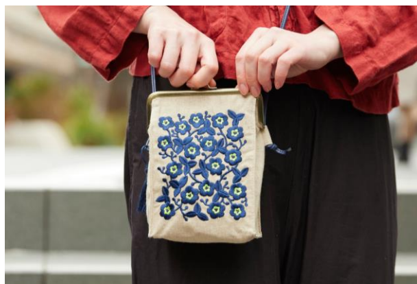
ひきだしポーチ・がまぐちぶらぶら ウクライナの花：5,720円（税込）