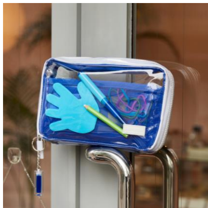
ひきだしポーチ・姉 とうめいブルー：4,180円（税込）