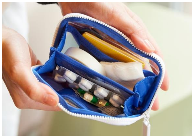
ひきだしポーチ・ポケット とうめいシリーズ (横125mm×縦85mm×厚さ17mm)