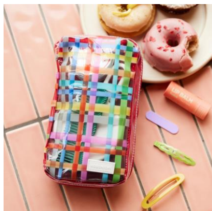
ちいさいひきだしポーチ とうめいチェック：4,180円（税込）