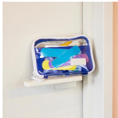
ひきだしポーチ・ポケット とうめいブルー：2,200円（税込）

これまでの布素材からイメージチェンジして、中身の見える透明のビニール素材で作った、カジュアルで軽やかなひきだしポーチ。布に比べて水にも強いので、お出かけやスポーツなど、いろいろなシーンで活用いただけます。形は、コンパクトながら収納力の高い「ちいさいひきだしポーチ」、長財布や貴重品入れとして重宝する「ひきだしポーチ・姉」、ミニ財布やカードケースにもなる「ひきだしポーチ・ポケット」の3種類。デザインは、明るい色の線が交わるポップな印象の「とうめいチェック」と、ビビッドな青と白の組み合わせが爽やかな「とうめいブルー」の2種類です。