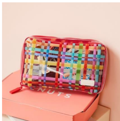
ひきだしポーチ・姉 とうめいチェック：5,280円（税込）