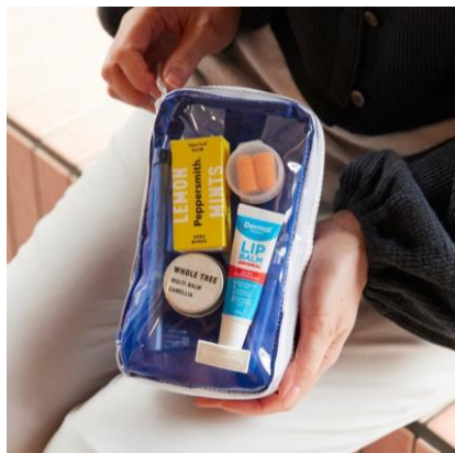
ちいさいひきだしポーチ とうめいブルー：3,080円（税込）