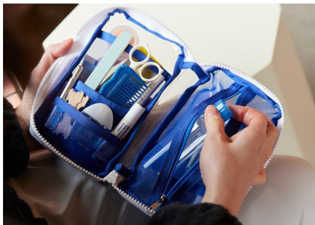
ちいさいひきだしポーチ とうめいシリーズ (横105mm×縦195mm×厚さ25mm)