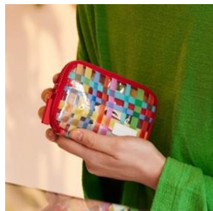
ひきだしポーチ・ポケット とうめいチェック：3,080円（税込）