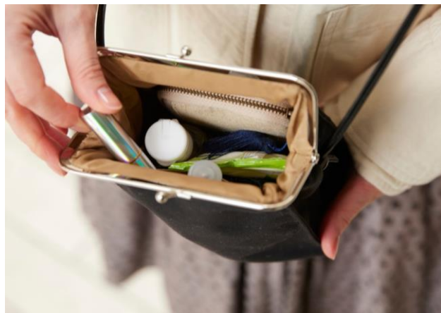
ひきだしポーチ・がまぐちぶらぶら (横143mm×縦181mm×マチ76mm/紐：約1200mm)