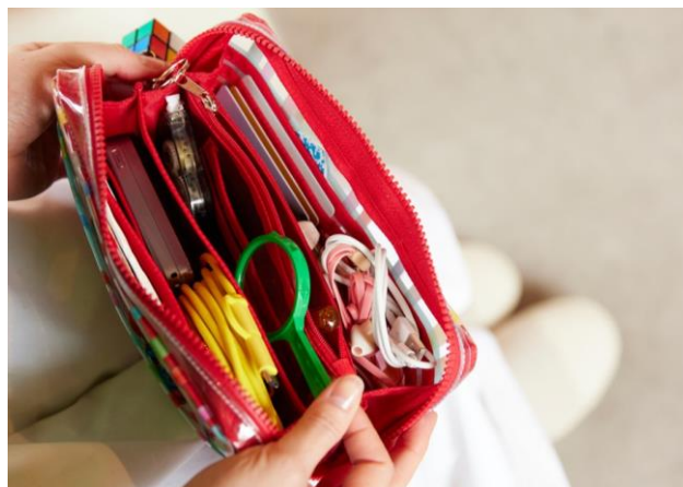
ひきだしポーチ・姉 とうめいシリーズ (横215mm×縦130mm×厚さ40mm)