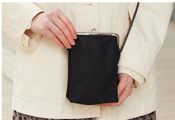
ひきだしポーチ・がまぐちぶらぶら ブラック：5,500円（税込）

外へ出かけるときはもちろん、室内やオフィス内で動き回るときなどに便利なポシェットタイプの「ひきだしポーチ・ぶらぶら」。その、口の部分をがまぐちににしたのが「がまぐちぶらぶら」です。中身が外に飛び出すことがないのでより安心感があります。すっきりとしていながらも収納力があり、がまぐち部分も片手でぱっと開閉できるので、使いやすいのがポイント。デザインは、ひきだしポーチシリーズでも大人気の刺繍柄「ウクライナの花」と、どんなファッションにも合わせやすいシンプルなブラックの2種類です。