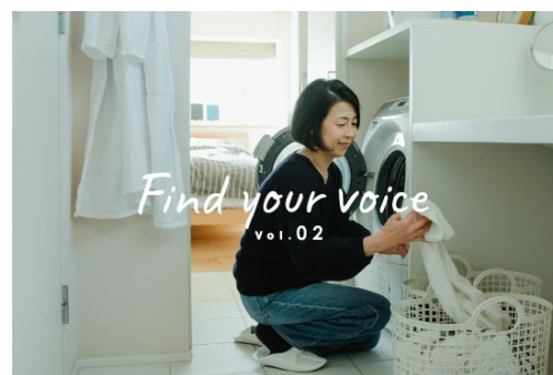
Find your voice

ライフスタイルによって異なる「お洗濯」。その中にあるお悩みや工夫をお伺いして、より良い暮らしのヒントを探ります。「前向きなココロとライフスタイルをランドリーシーンから」をモットーにしてきたフレディ レックのこれからを、みなさんの声とともに成長させていく試みです。