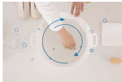
HOW TO LAUNDRY

洗濯のプロフェッショナルであるフレディ レックのスタッフが、ランドリーグッズを使った衣類やスニーカー、リネンなどの洗い方をお伝えします。お気に入りのものを自分の手で美しく保ち、ながく愛用できるような、お手入れの方法もご紹介します。