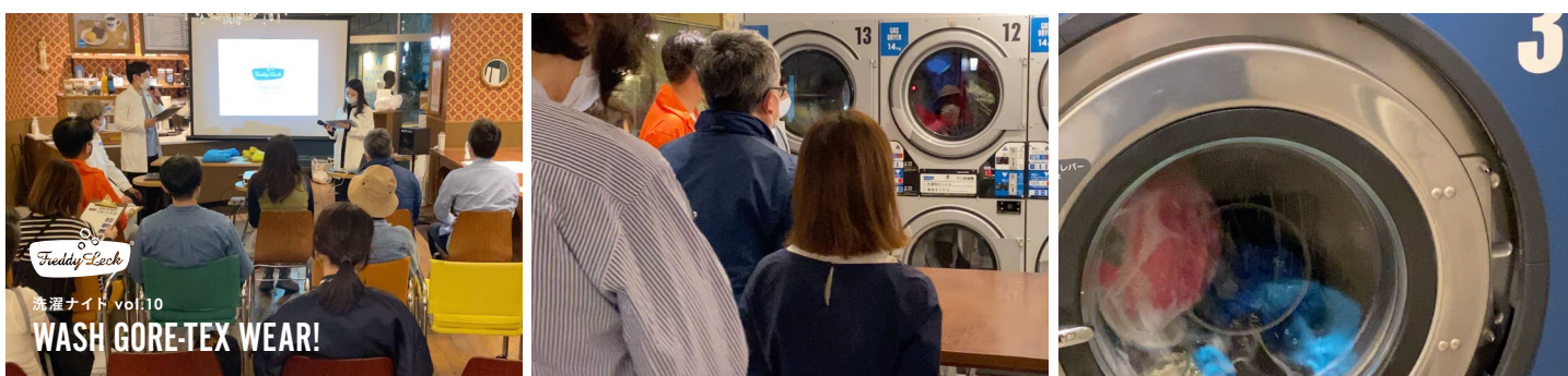
※洗濯ナイト vol.10 ゴアテックスウェアを洗おう！の様子

洗濯のノウハウを身につけるワークショップや、「洗濯」をテーマにしたトークイベントなど、フレディ レック・ウォッシュサロン トーキョーやオンラインを中心に不定期で開催。洗濯をより身近に、そしてさらに楽しめるようなイベントを企画しています。