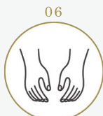
06 リンパマッサージ (首/肩/デコルテ)