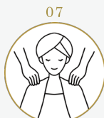
07 アフターカウンセリング