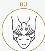
03 マッサージシャンプー