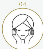
04 リフトアップマッサージ