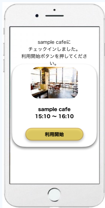
着席したら利用開始