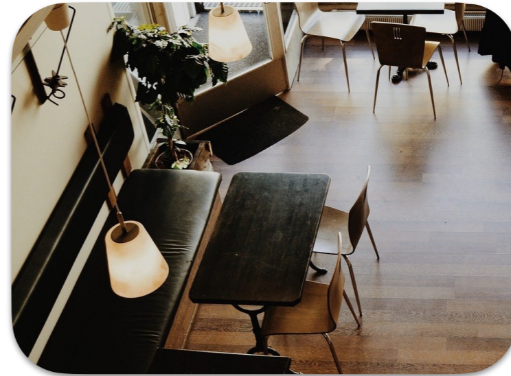
埋まりづらい空席