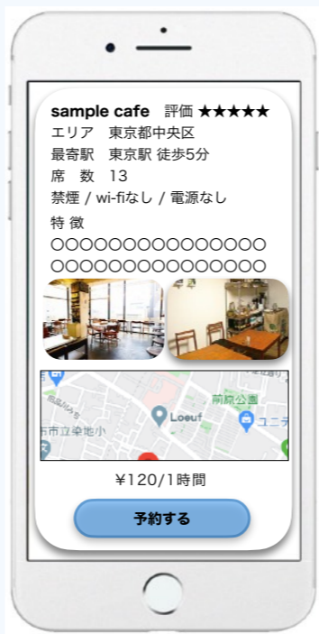
その場で予約&決済