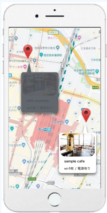
現在地から空席確認