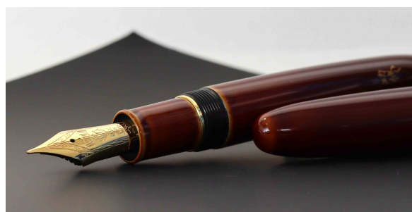
セーラー万年筆独自の21金ペン先