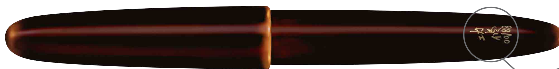
溜塗り万年筆『白溜め』

使い込むほどに艶やかさをまとう逸品です。海外でも非常に評価が高く、広く支持されています。