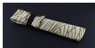
特製(正絹)一本袋付き