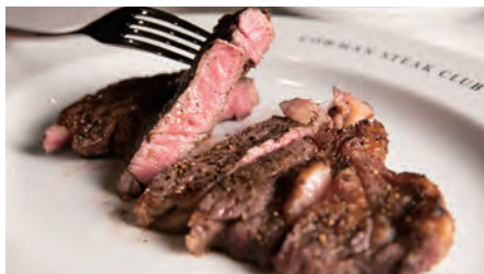
リブアイステーキ 300g ¥6,500