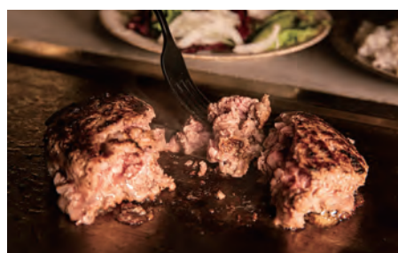
ランチ：牛100% ハンバーグステーキ 200g ¥950

ランチタイムはブッチャーで選びいただいた肉をスタッフがお預かりしてレア状態で炭火焼き。テーブルにてお好みの焼き加減に仕上げしてお召し上がりください。ディナータイムはいろいろな部位を気軽にお楽しみいただけるよう、牛串(プロシット)を中心に、お酒に合う小皿メニューをご用意しました。夏季は外のテラス席でもグリルスタンドのメニューをお楽しみください。(客単価 ランチ 1200円～3000円、ディナー 3000円後半～4500円を予定)