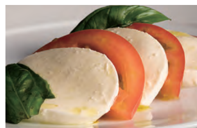
フレッシュモッツアレラ & トマト ¥1,200