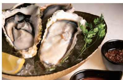
フレッシュオイスター 4ピース ¥2,000