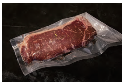
価格は店頭にてご確認ください。

サーロイン、リブローズ、ハンバーグなどの部位ごとにカットして真空パック。フレッシュなまま、チルド状態でお持ち帰りください。こちらのカット肉はオンラインショップでもご購入可能です。(客単価 1000円～4000円代を予定)