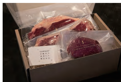
ハンバーガー ¥1,200 ※ドリンク別

ハンバーガー好きの皆様にとこと満足いただける、ダイナミックな牛肉100%パテのハンバーガー&ポテトをお持ち帰り用に。営業時間中はテラス席でもお召し上がりいただけます。(客単価 1200円～を予定)