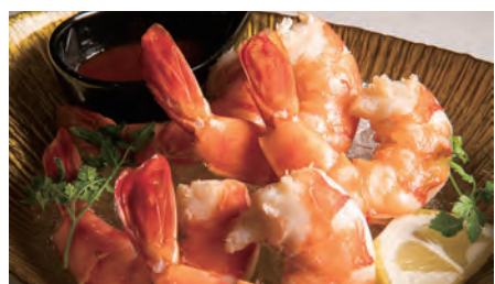
ジャンボシュリンプカクテル ¥1,800