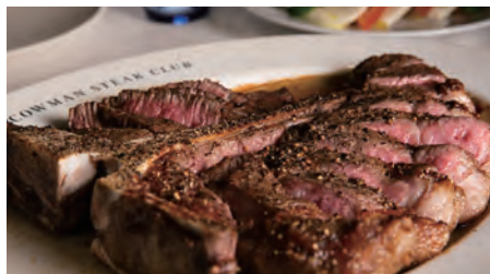
ポーターハウスステーキ 850g (2人前) ¥9,600

「カウマンの秘密部屋」をテーマにした、肉好きのための本格ステーキハウス。看板メニューの「Tボーンステーキ」には熟成とフレッシュの2種類をご用意しています。アメリカの本場のステーキを、肩肘張らずにお楽しみください。(客単価 10000円～15000円を予定)